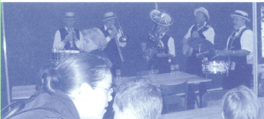
The Ol' 'Men Streetband'